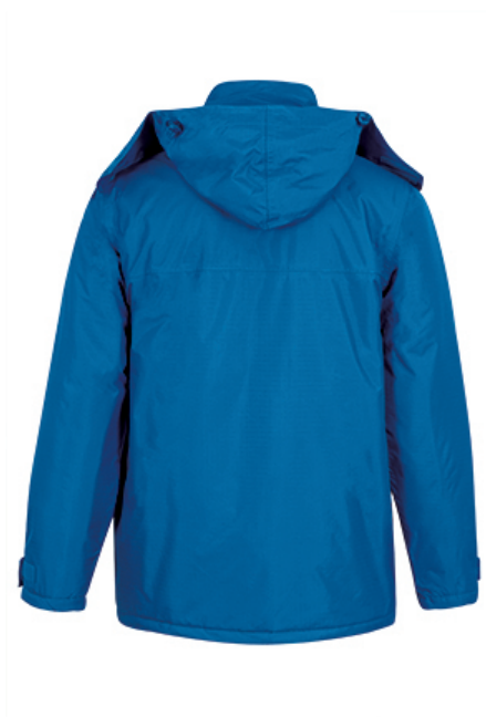
Vista parte trasera de la prenda (espalda)